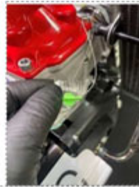
片側からワイヤが出ている隣の穴にワイヤの先を通します。