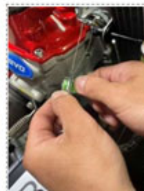
封印のバースを保持し、緑のつまみを時計回りに少しずつ回してワイヤを巻いてください。