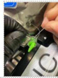
ワイヤのテンションを少し緩めに保ってください。