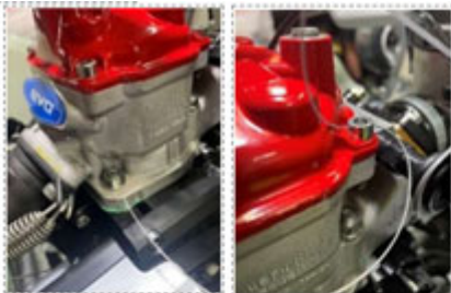
シリンダー→ヘッドカバーの順にワイヤを通します。