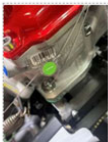
ワイヤを巻ききると、緑のつまみ部分が折れてワイヤがロックされ、封印完了です。